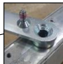
vis ferme-porte (Inox)