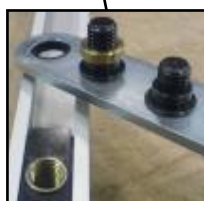
vis glissière (Noir)