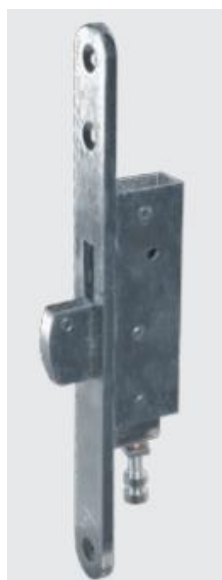
Coffre haut et bas