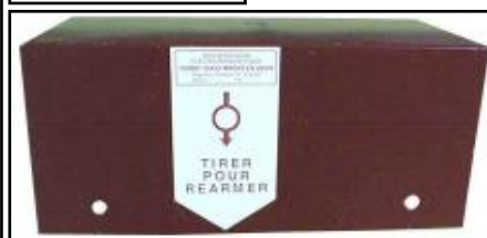
Carter de protection