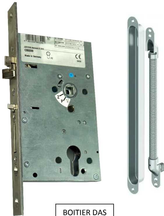
BOITIER DAS à PREVOIR