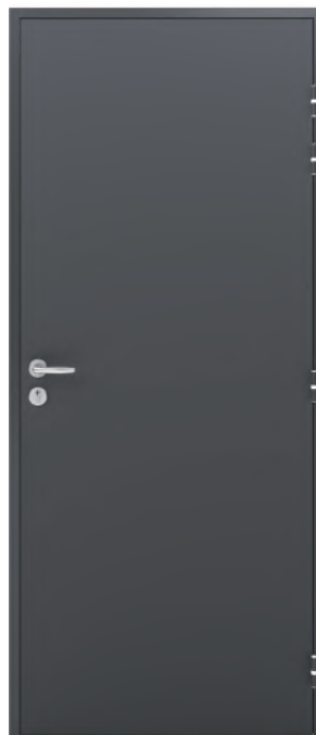
ADAPTA'SERV Finition laquée RAL 7016