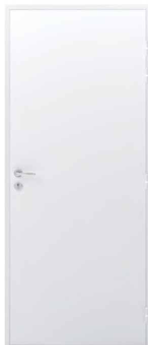
ADAPTA'SERV Finition laquée RAL 7035