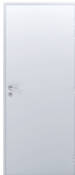
ADAPTA'SERV Finition laquée RAL 9006