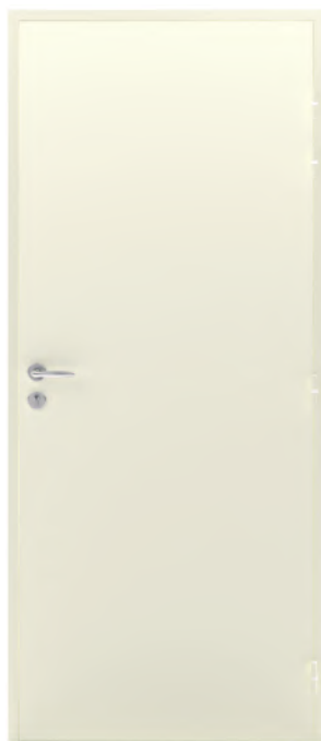
ADAPTA'SERV Finition laquée RAL 1015