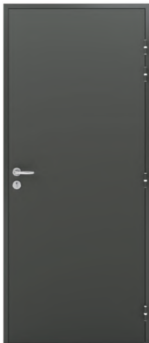
ADAPTA'SERV Finition laquée RAL 7022