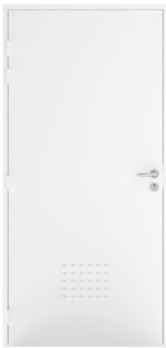
ADAPTA'CAV Finition laquée RAL 9010