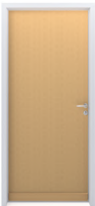
SYLVER 700 Finition brute ou lasurée