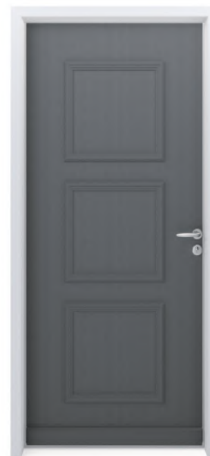
SYLVER 730 Finition brute ou lasurée