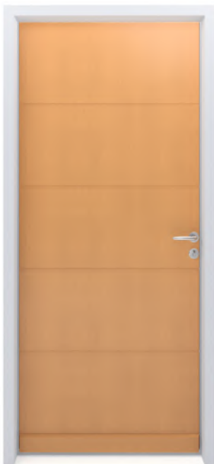
SYLVER 4R Finition brute ou lasurée