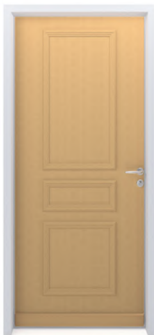
SYLVER 7300 Finition brute ou lasurée