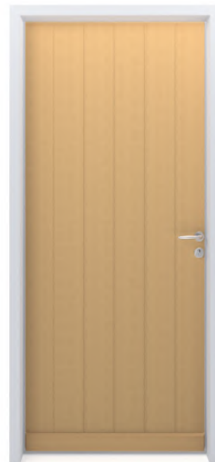
SYLVER 700R Finition brute ou lasurée