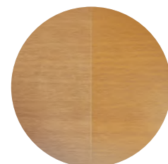
Finition brute (à gauche) et finition lasurée (à droite) Esence de bois susceptible de changer en fonction des disponibilités