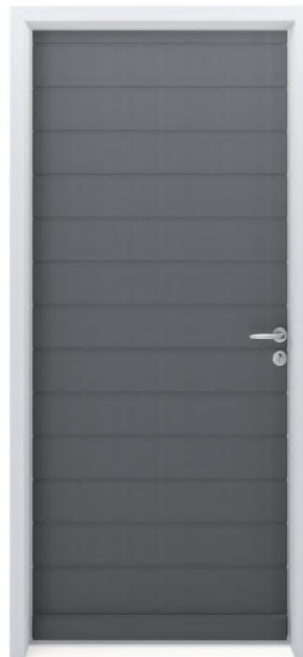
SYLVER 13R Finition brute ou lasurée