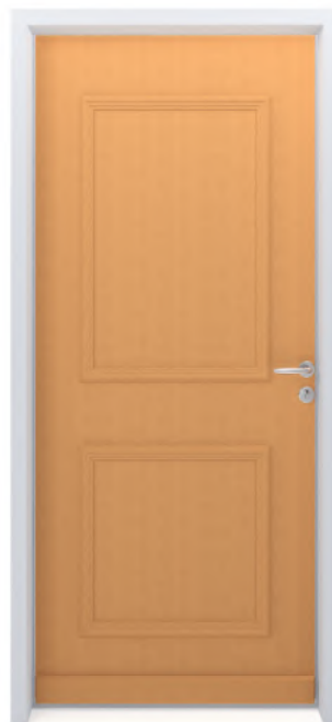
SYLVER 7200 Finition brute ou lasurée