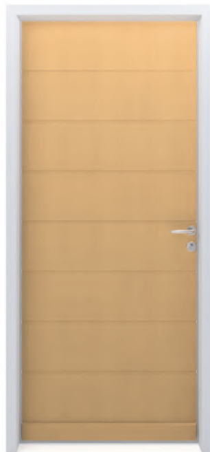
SYLVER 7R Finition brute ou lasurée